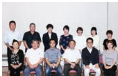
▲設立に尽力された志木の杜町内会の皆さん

また、大規模災害時に備えて、自主防災組織の設立や行政と連携できる体制、そして、いざというときに助け合える関係を住民同士で築くためにも、町内会の必要性を感じました。