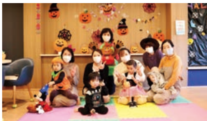
▲10月29日に実施したハロウィンの様子

感染防止対策として、0～1歳児対象と2～3歳児対象の二部構成で実施しています。キッズスペースがある集会室で、子どもたちを遊ばせながら、友達づくりや情報交換ができる居心地のよいサロンを目指しています。「NPO法人志木子育てネットワークひろがる輪」にも協力を依頼し、今後も季節ごとの楽しいイベントを開催予定です。