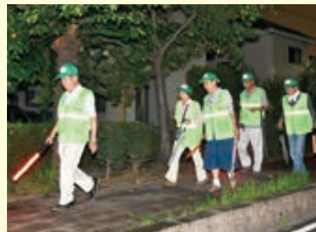
▲自主防犯パトロール隊の活動の様子

このように、わたしたちが安心して暮らせる環境を築くため、町内会は欠かせない存在なのです。