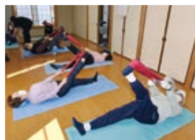
▲適度に負荷をかけての体操