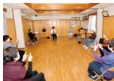
▲脳トレも楽しくチャレンジ