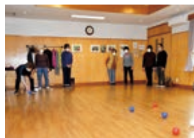
▲脳トレの後はポッチャで運動