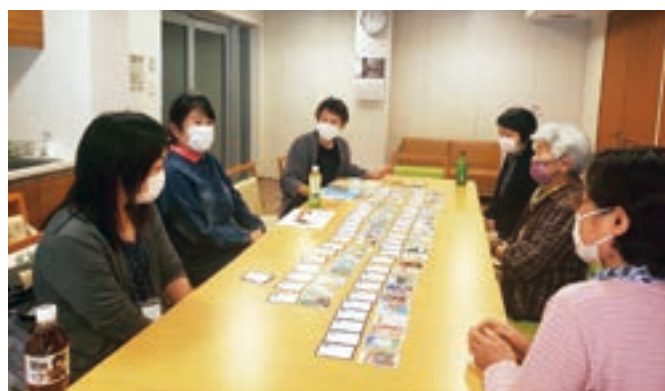
▲11月12日に実施した志木郷土かるたを楽しむ様子

事前にアンケートを行ったところ、太極拳やヨガなどの運動のほかに、囲碁、ボードゲーム、コーラスなどの趣味を楽しむ場になりたいという回答がありました。「高齢者あんしん相談センター柏の杜」とも連携し今後は、「子ども会」のかるた練習に参加してもらうなど、多世代交流のきっかけ作りも目指しています。